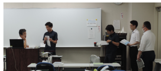
講師に質問している様子

URL： https://www.zeikyo.or.jp/r07seminar01/